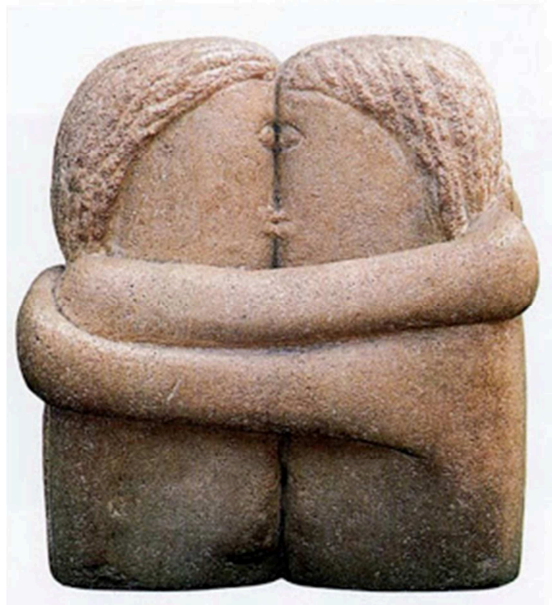
La besada , Brancusi, 1912

OPCIÓ 2.2: Relació entre les arts: pintura i música, a partir d'aquestes dues obres: Autoretrat d'Eugène Delacroix, 1837, i música de Beethoven