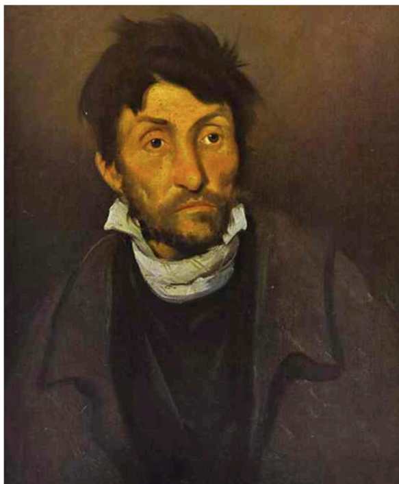
El cleptòman , d'Eugène Géricault, 1822

OPCIÓ 2.1: Compara aquestes dues obres: El cleptòman , d'Eugène Géricault, 1822, i L'aquellarre , de Francisco de Goya, 1821/23