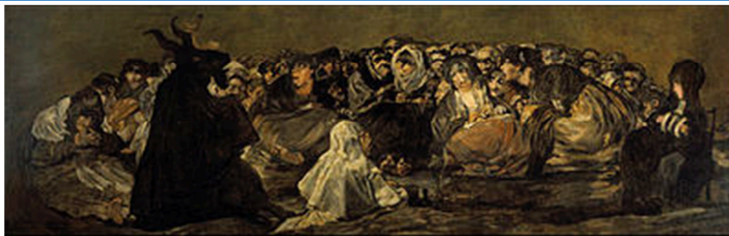
L'aquelarre , de Francisco de Goya, 1821/23

OPCIÓ 2.2: Relació entre les arts: l'edifici modernista i les arts. Explica l'arquitectura com a integradora de les arts en aquest moviment